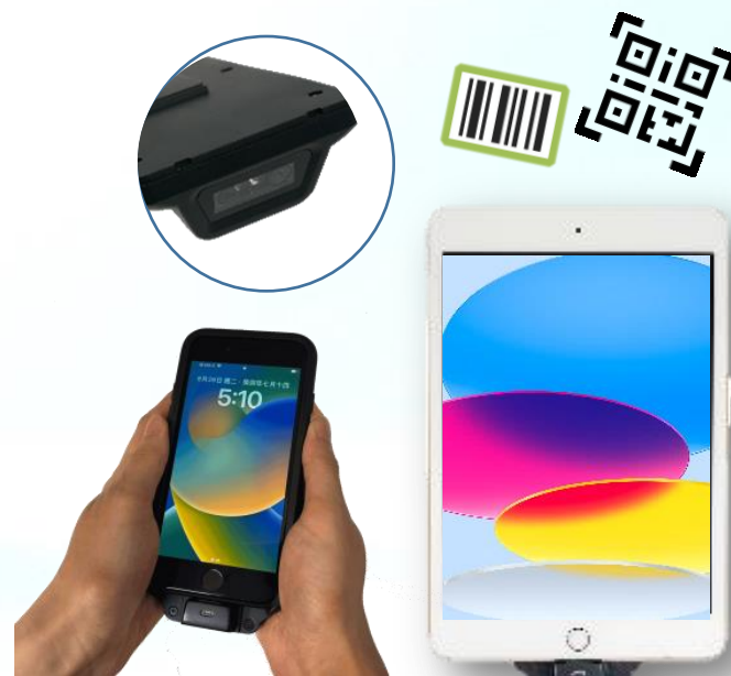
SL220 iOS Sled 條碼掃描器